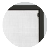
ÉCRAN DE SÉCURITÉ