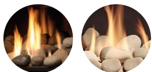
COLLECTION DE ROCHES