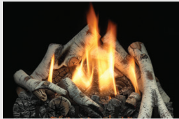
MQLOGF36BW Bûches bouleau SOLACE II