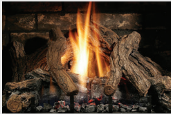
LOGF36 Chêne fendu SOLACE