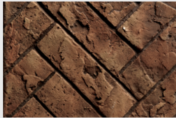
RLH Brique en chevron