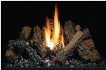
LOGC44 SOLACE II