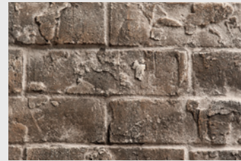
RLT Brique traditionnelle