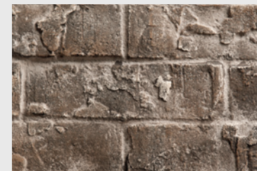
RLT Brique traditionnelle

Pour consulter les dernières évolutions dans le monde des foyers, visitez le marquisfireplaces.net