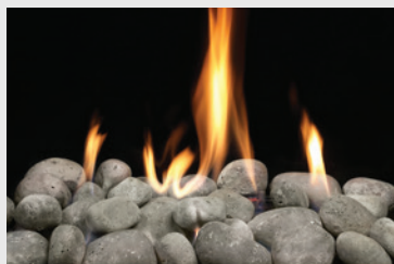
MQROCK2 Roches naturelles

PLATEFORME DE SUPPORT REQUISE (SOLACE SEULEMENT)