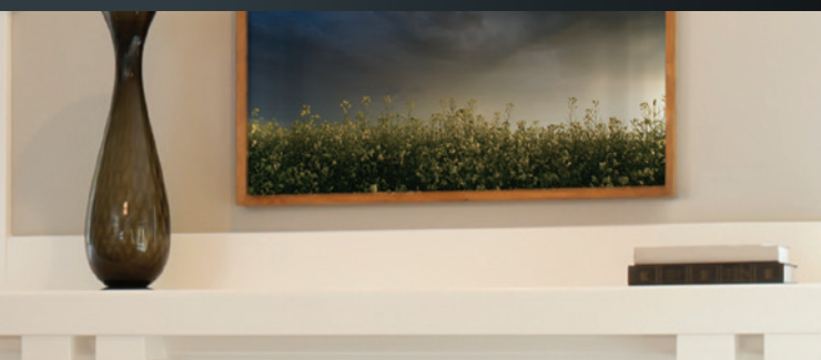
Appareil illustré : Foyer à évacuation directe Solace II HBZDV3624NE, l'ensemble de bûches chêne MQLOGC45, l'ensemble pleine vision Designer HB36CVCK, la doublure de brique en chevron HB36RLH.