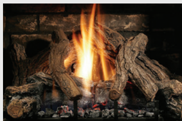
LOGF36 Chêne fendu (SOLACE)