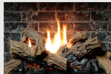
MQLOGC45 Chêne brûlé (SOLACE II)