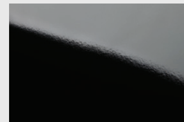
PL Porcelaine réfléchissante