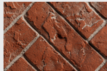
RRH Brique en chevron rouge