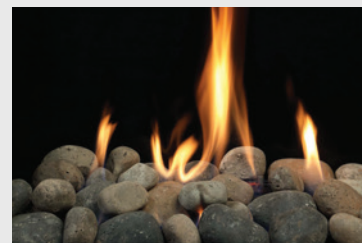
MQROCK3 Roches multicolores