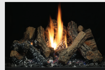
LOGC44 (SOLACE II)