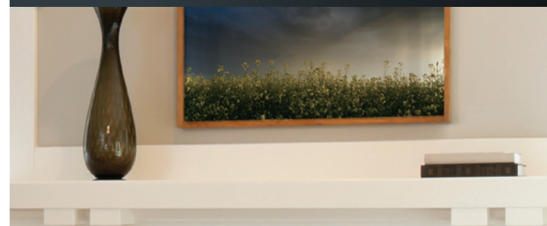
Appareil illustré : Foyer à évacuation directe Solace II HBZDV3624N, l'ensemble de bûches chêne MQLOGC45, l'ensemble pleine vision Designer HB36CVCK, la doublure de brique en chevron HB36RLH.