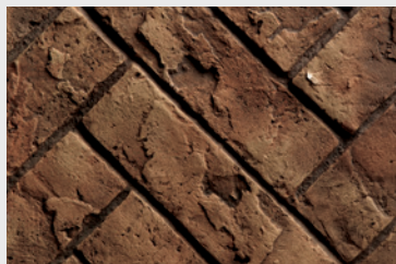
RLH Brique en chevron