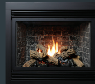
Appareil illustré : Foyer à évacuation directe Solace II HBZDV4224N, l'ensemble de bûches chêne MQLOGC45, l'ensemble de grille HB42GBL (noir), la doublure de brique traditionnelle HB42RLT.